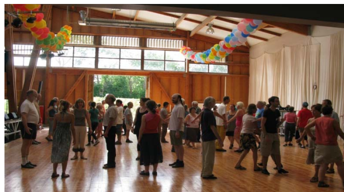
Bal de l'Europe Saint-Gervais 2013