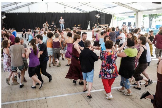
Bal de l'Europe Gennetines 2013