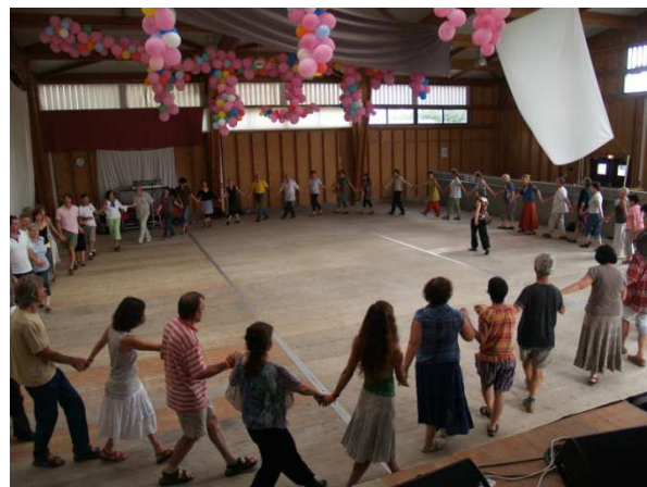
Bal de l'Europe Saint-Gervais 2011