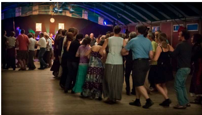
Bal de l'Europe Gennetines 2012