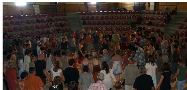
Bal de l'Europe Saint-Gervais 2011